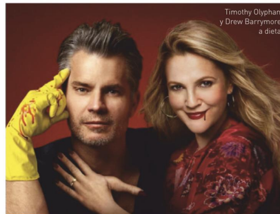
Timothy Olyphant y Drew Barrymore, a dieta.