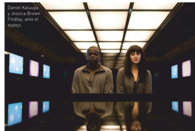
Daniel Kaluuya y Jessica Brown Findlay, ante el espejo.

Prima hermana de la exitosa 'Narcos' centrada en Pablo Escobar y demás traficantes colombianos, esta vez la historia se traslada a México, durante la misma década de los 80, para narrar las ansias de poder y de dinero de otro grande de la droga, Félix Gallardo (Diego Luna). Netflix aún