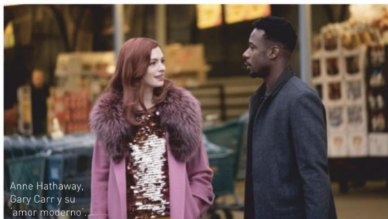
Anne Hathaway, Gary Carr y su 'amor moderno'.