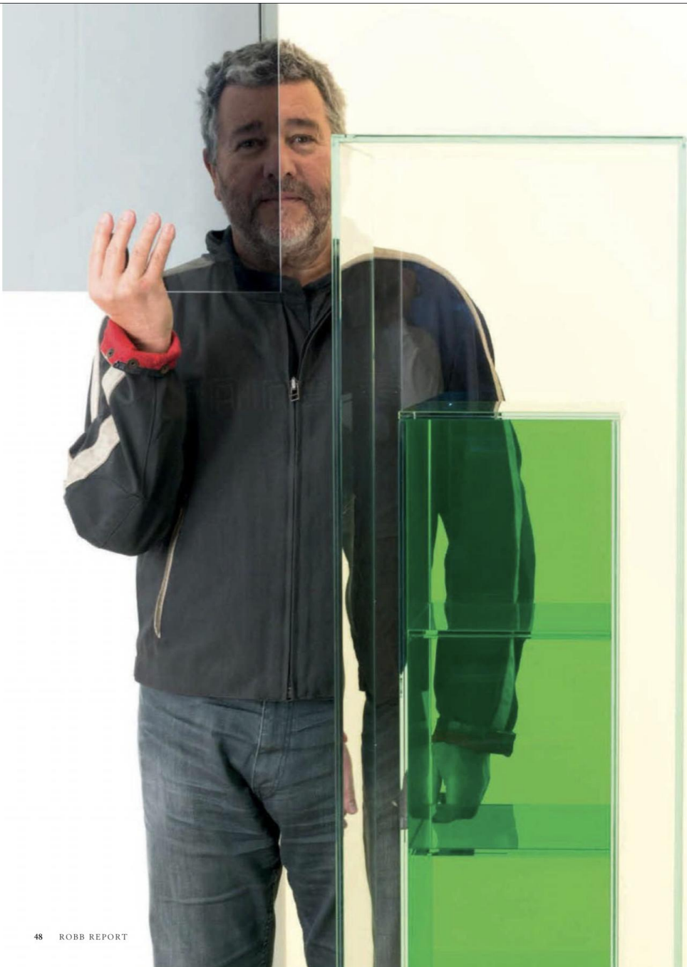
FOTOGRAFÍA (PHILIPPE STARCK); CESARE CHIMENTI / FOTOGRAFÍA (HOTEL); VINCENT BENGOLD

botellas de vino, gadgets , megayates e incluso prendas de ropa o perfumes, sólo por esbozar algunos trazos de su infinito portfolio . En él también encontramos restaurantes (como el Ramses de Madrid), puertos deportivos (como Port Adriano en Mallorca), grandes espacios públicos (como La Alhóndiga de Bilbao)... y, por supuesto, hoteles. Y en este Travel Issue que tienes entre manos hacemos un repaso de los más emblemáticos.