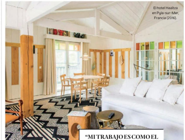
El hotel Haaitza en Pyla-sur-Mer, Francia (2016).

“MI TRABAJO ES COMO EL DE UN DIRECTOR DE CINE, A TRAVÉS DEL DISEÑO DE LOS HOTELES CUENTO HISTORIAS Y OFREZCO AL PÚBLICO LA NOCIÓN ESPIRITUAL DE LOS LUGARES QUE VISITAN”.