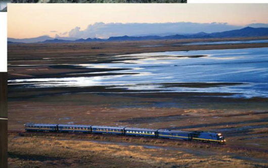
Abajo, el lujoso interior del tren Hiram Bingham y el tren rumbo a Machu Picchu.