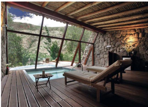
Arriba, el spa del Hotel Río Sagrado. A la dcha., una de las suites de Palacio Nazarenas. Abajo, Plaza de Armas de Cuzco.